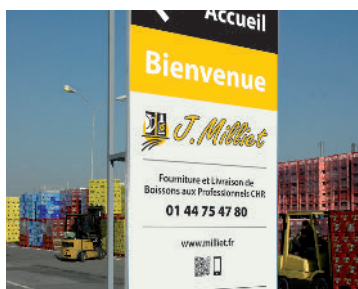
Bienvenue chez J. Milliet - réseau Distributeurs