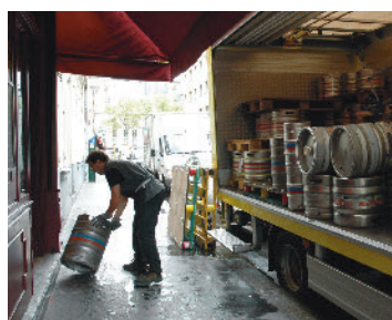
une équipe à votre service